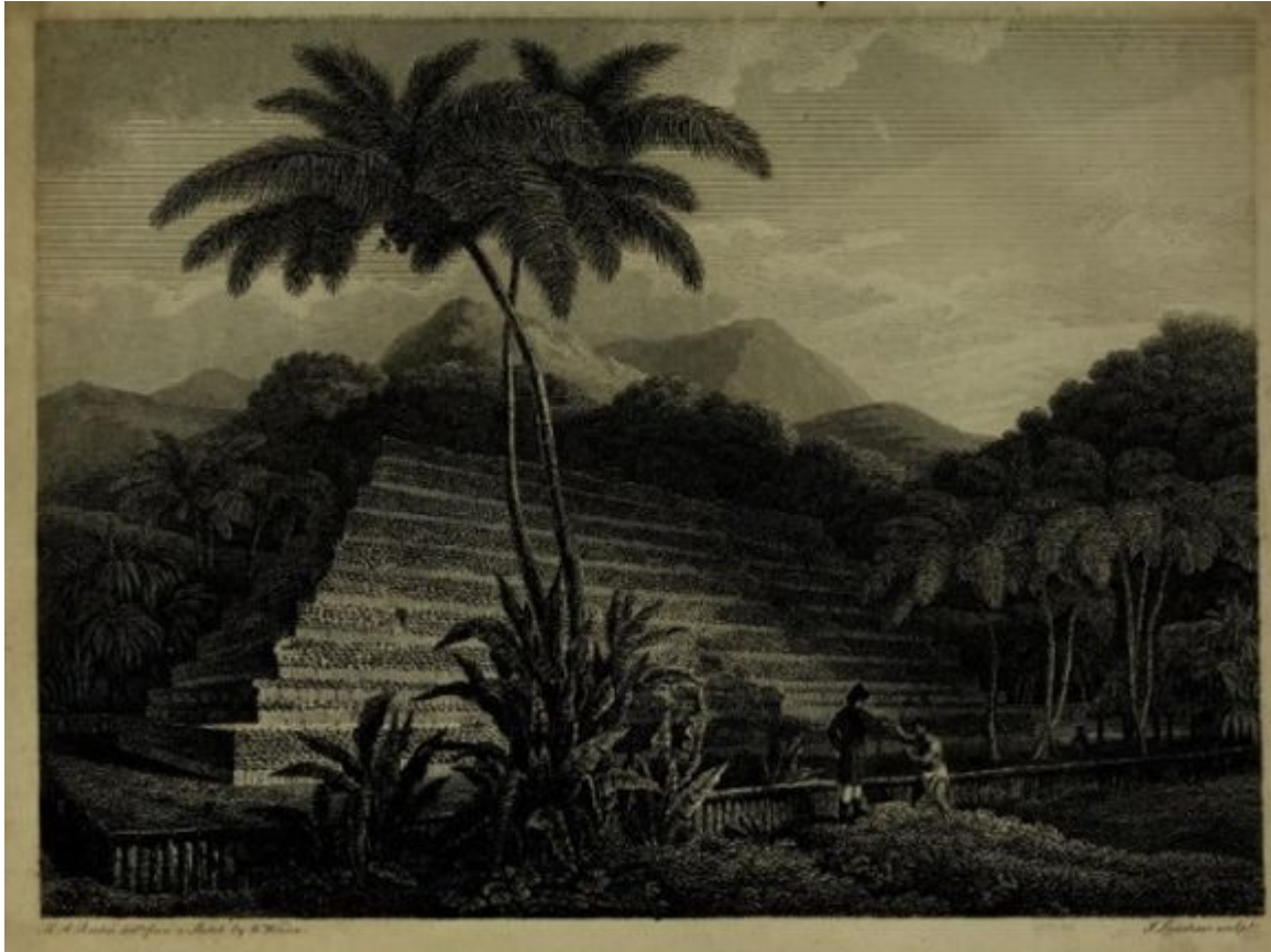
Desetistupňová pyramida z Tahiti, dnes rovněž rozebraná; deset pyramidálních stupňů má odpovídat deseti nebesům polynéské kosmologie.

Peter Buck, jenž tahitskou pyramidu Mahaitea navštívil, píše: