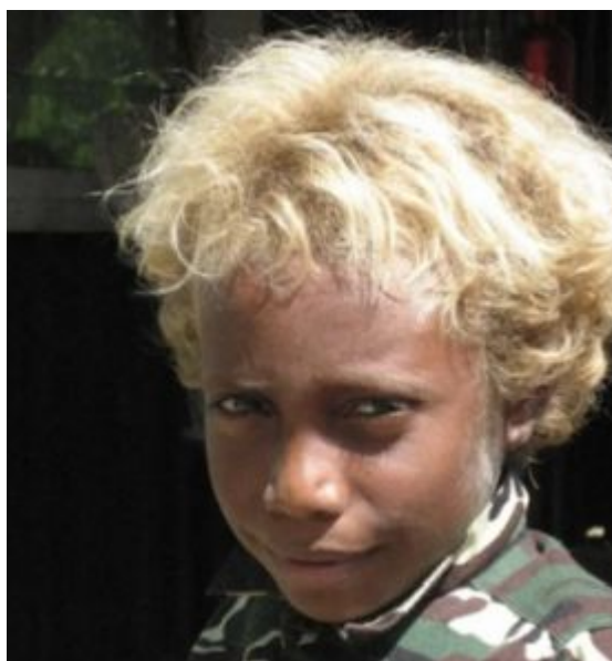
Pět až deset procent obyvatel Salomounových ostrovů v Melanésii má výrazně světlé vlasy