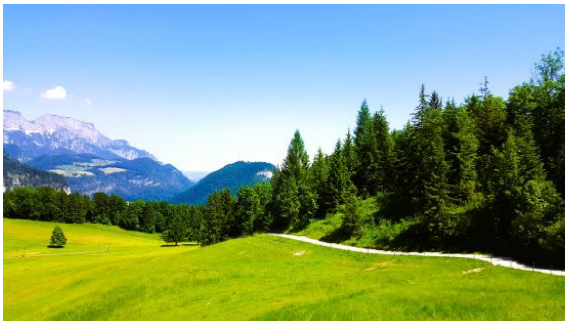
Cesta z Berghofu na Mooslahnerkopf