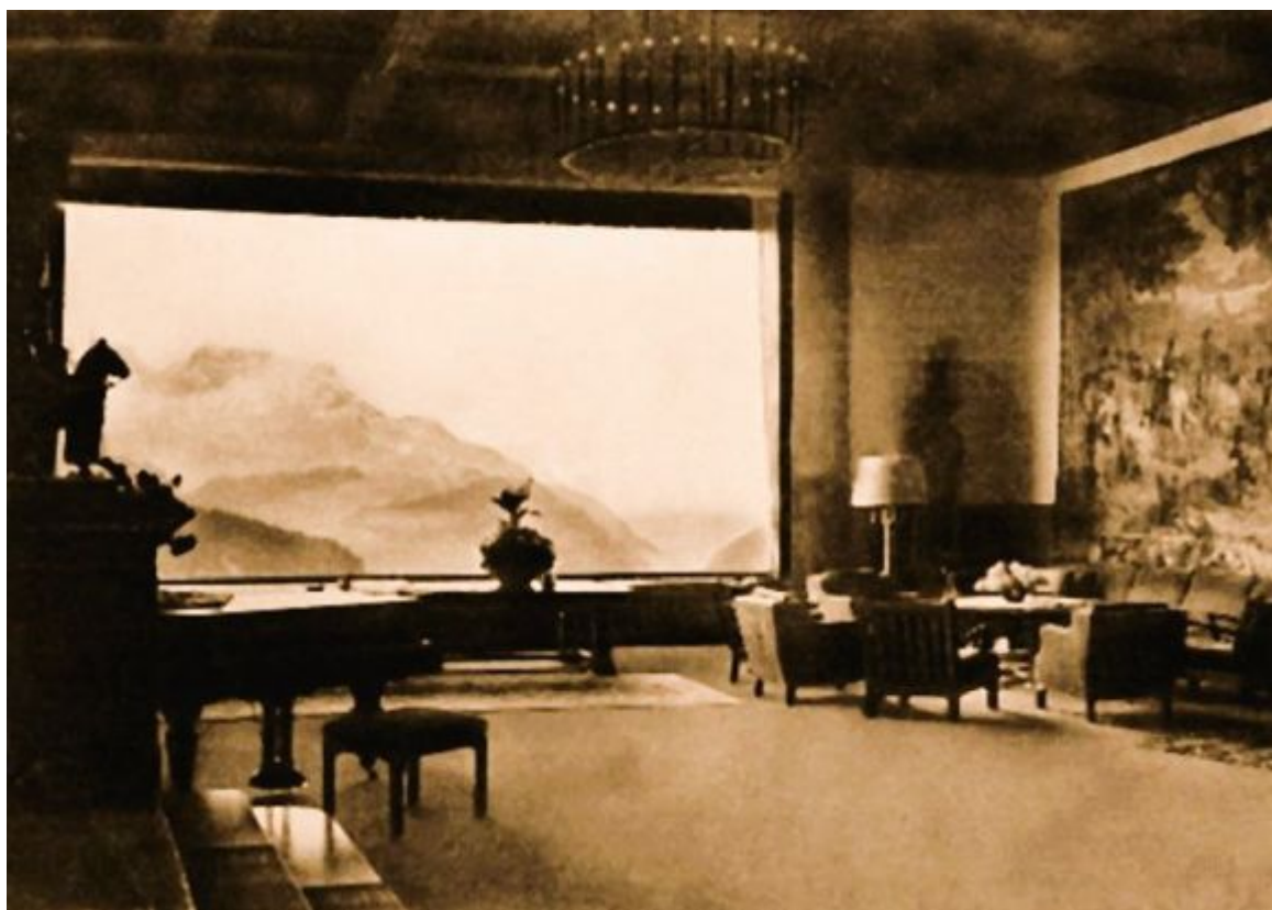
Velký pokoj Berghofu s otevřeným panoramatickým oknem, začátek čtyřicátých let

Hitlerovo venkovské sídlo na alpském Obersalzbergu, zvané Berghof (respektive jeho trosky) bylo v roce 1952 z nařízení bavorské vlády vyhozeno do povětří. Podle legendy se v okamžiku exploze objevil na zdi domu obrovský obrazec zvrácené lebky, prý symbolizující konec Německa. Dnes je tady všechno důsledně srovnáno se zemí, zarostlé lesem, a i zde zřízenec pravidelně odstraňuje každou svíčku nebo drobnou květinu, příležitostně položenou ke zbytku opěrné zdi zadního traktu Berghofu, jediné části stavby, jejíž torzo zůstalo zachováno. Důkladnost exorcistů šla tak daleko, že na zbořeniště byla navezena suť z jiných ruin, aby si návštěvník nemohl odnést ani úlomek kamene nebo cihly z bývalého Hitlerova sídla.