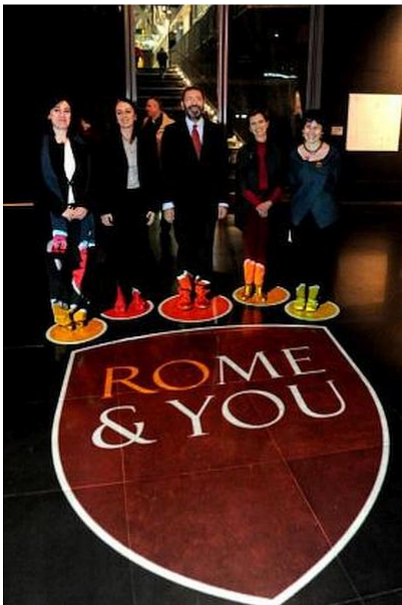
Rome & Jew?