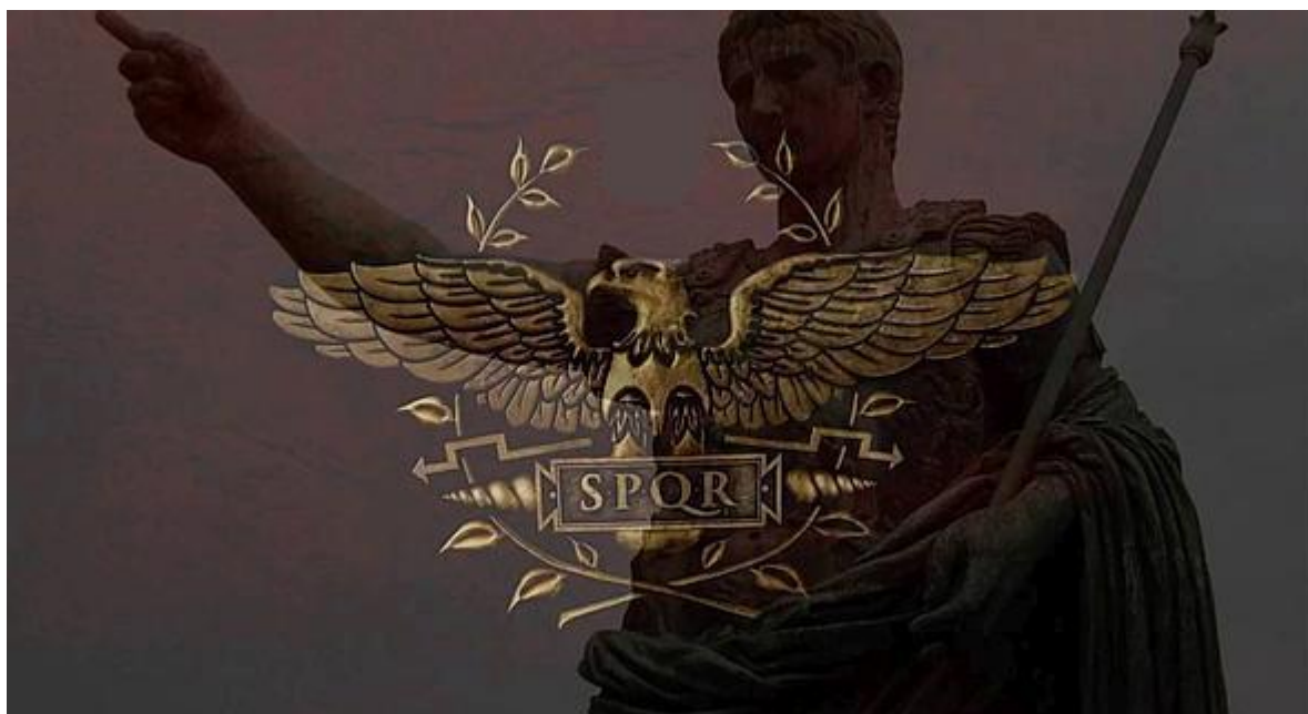
Caesar: Voják, Tvůrce, Autokrat

15. března, před více jak dvěma tisíci lety, byl v Římě, na místě, kde je nyní Corso Vittorio Emanuele, jedna z nejživějších tříd, ubodán mnohačetnými ranami spikleneckých dýk Gaius Julius Caesar.