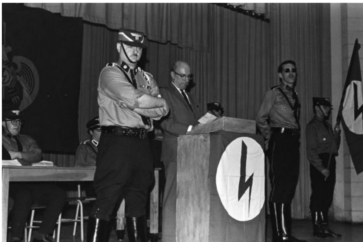
James Madole v projevu na setkání National Renaissance Party (Wagner High School, 18. března 1966)