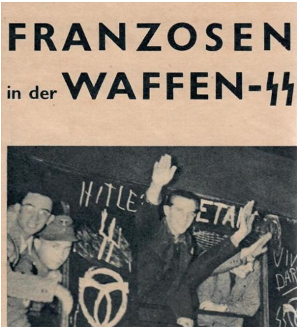
„Vlak plný nováčků. Nápisy na vagonu svědčí o duchu dobrovolníků, kteří odjíždějí do výcvikového tábora,“ říká popiska k této fotografii na dvoustraně věnované francouzským adeptům černého řádu v Signalu z ledna 1944.

Str. 203 Zdrčení civilisté... V zázračnou neporazitelnou Říši věřili až do konce. Ale když opustili své statky, veškerou naději ztratili. Zlomená hrdost starých germánských kolonistů. Kolem nich se hroutí svět za svitu požárů a křiku znásilňovaných dívek. Adolf Hitler byl jejich bohem. Ale rudé tanky a děla zvěstují, že v Pomořanech je bůh mrtev. (...) Po obou stranách cesty jsou na frontu francouzští esesmani. Jim také nezbývá žádná naděje a budoucnost. Jen odvaha a věrnost.