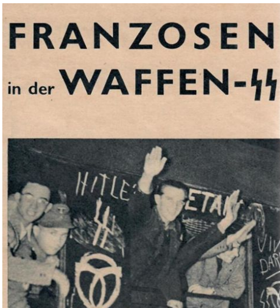
„Vlak plný nováčků. Nápisy na vagonu svědčí o duchu dobrovolníků, kteří odjíždějí do výcvikového tábora,“ říká popiska k této fotografii na dvoustraně věnované francouzským adeptům černého řádu v Signalu z ledna 1944.

Str. 203 Zdrčení civilisté... V zázračnou neporazitelnou Říši věřili až do konce. Ale když opustili své statky, veškerou naději ztratili. Zlomená hrdost starých germánských kolonistů. Kolem nich se hroutí svět za svitu požárů a křiku znásilňovaných dívek. Adolf Hitler byl jejich bohem. Ale rudé tanky a děla zvěstují, že v Pomořanech je bůh mrtev. (...) Po obou stranách cesty jsou na frontu francouzští esesmani. Jim také nezbývá žádná naděje a budoucnost. Jen odvaha a věrnost.