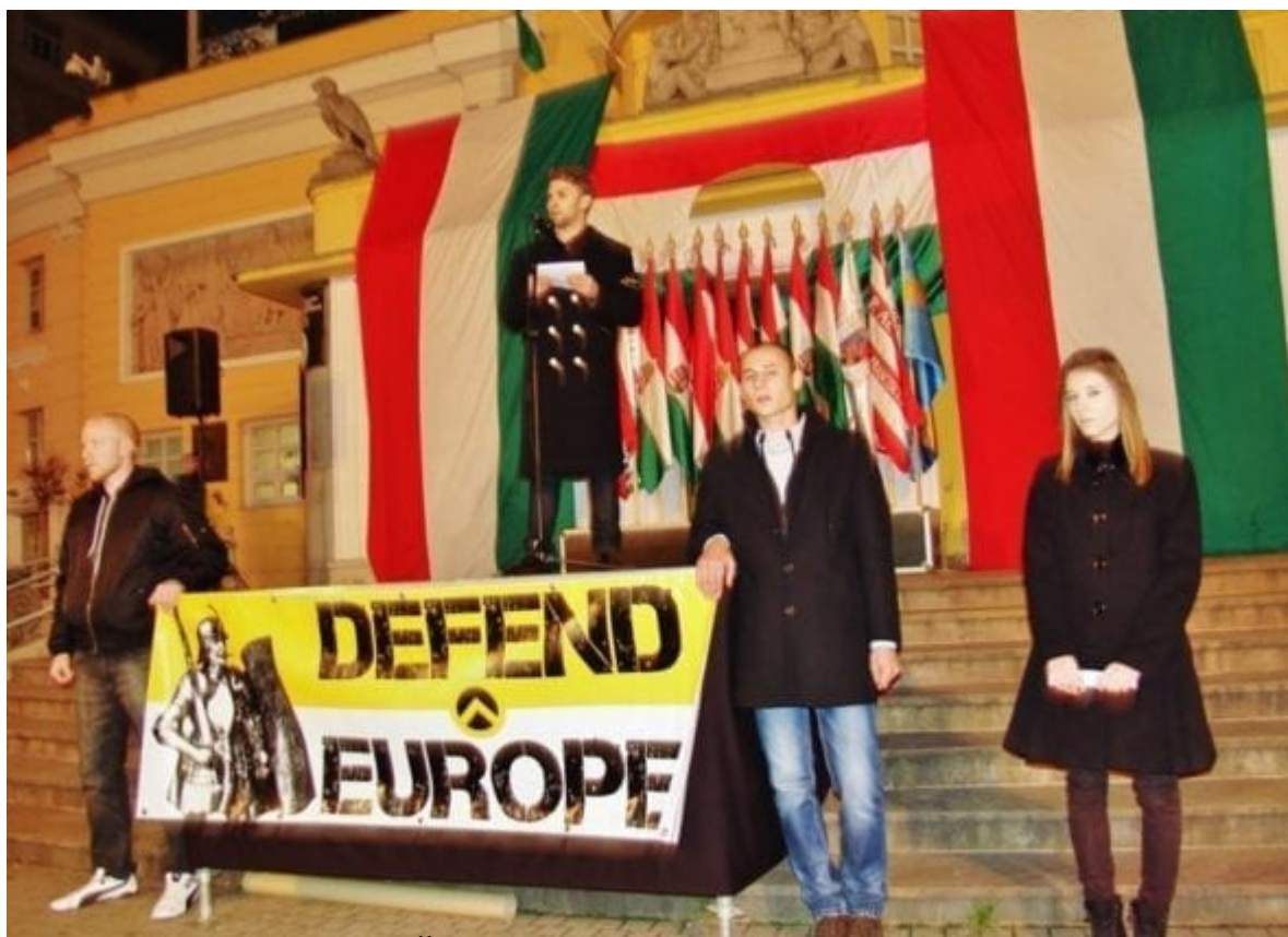
Identitářství v praxi: Členové Identitás Generáció před kinem Corvin, jedním z největších center odporu během Maďarské revoluce v roce 1956, u připomínky jejího šedesátého výročí 23. října 2016.