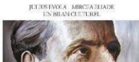
JULIUS EVOLA - MIRCEA ELIADE UN BILAN CULTUREL