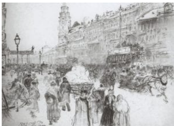
Ilya Repin – Něvský prospekt