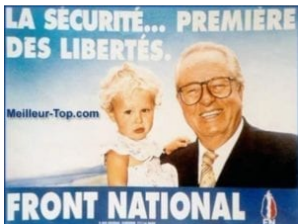
Marion s dědečkem na předvolebním plakátu z roku 1990

Předpovídá se úspěch Marine Le Pen na severu Francie a její neteř Marion má „slušné šance“ uspět na jihovýchodě.