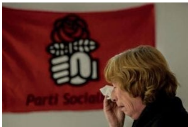
Roň slzy, už brzy...

To by znamenalo prohru socialistů prezidenta Françoise Hollanda, kteří kromě celostátní kontrolují také většinu regionálních vlád.