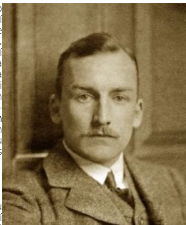
John Frederick Charles „Boney“ Fuller (1 . 9. 1878 - 10. 2. 1966)

Roku 1897 začal Fuller studovat na Royal Military College a následujícího roku byl odeslán do posádkové služby v Irsku. I když měl rád šerm i střelbu, nepřilnul mladý voják k společenské zábavě důstojnických kruhů. Zatímco jeho spolužáci vyjížděli na lov se psy, Fuller v samotě své studovny četl – ze všech věcí – zrovna filozofii. Jeden z jeho spolužáků poznamenal, že Fullerova konverzační zdatnost a kousavý smysl pro humor často „vyvolával v kantýně naprostý zmatek a nechápavé pohledy.“ Už od samého počátku tak byl, jak sám řekl, „tím nejnetradičnějším vojákem.“