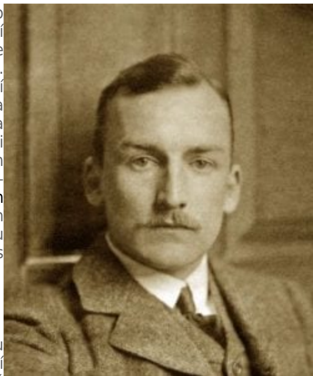
John Frederick Charles „Boney“ Fuller (1 . 9. 1878 - 10. 2. 1966)

Roku 1897 začal Fuller studovat na Royal Military College a následujícího roku byl odeslán do posádkové služby v Irsku. I když měl rád šerm i střelbu, nepřilnul mladý voják k společenské zábavě důstojnických kruhů. Zatímco jeho spolužáci vyjížděli na lov se psy, Fuller v samotě své studovny četl – ze všech věcí – zrovna filozofii. Jeden z jeho spolužáků poznamenal, že Fullerova konverzační zdatnost a kousavý smysl pro humor často „vyvolával v kantýně naprostý zmatek a nechápavé pohledy.“ Už od samého počátku tak byl, jak sám řekl, „tím nejnetradičnějším vojákem.“