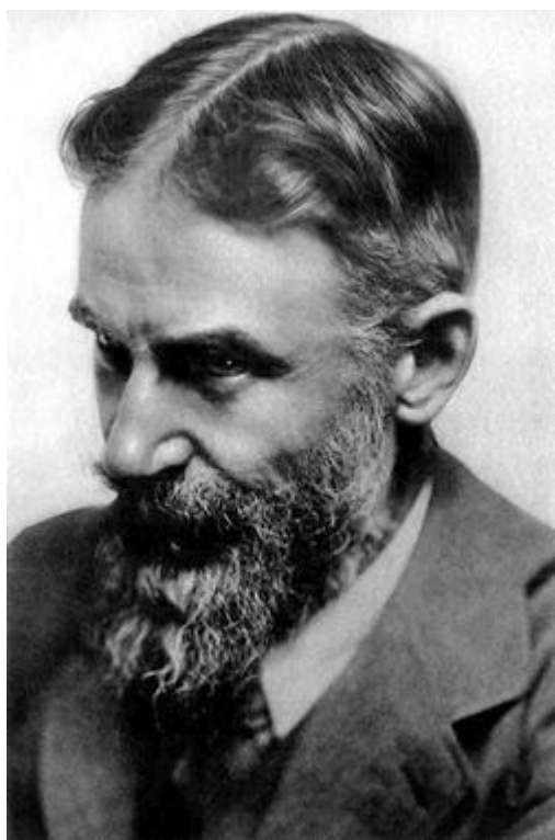
George Bernard Shaw (26. července 1856 – 2. listopadu 1950)