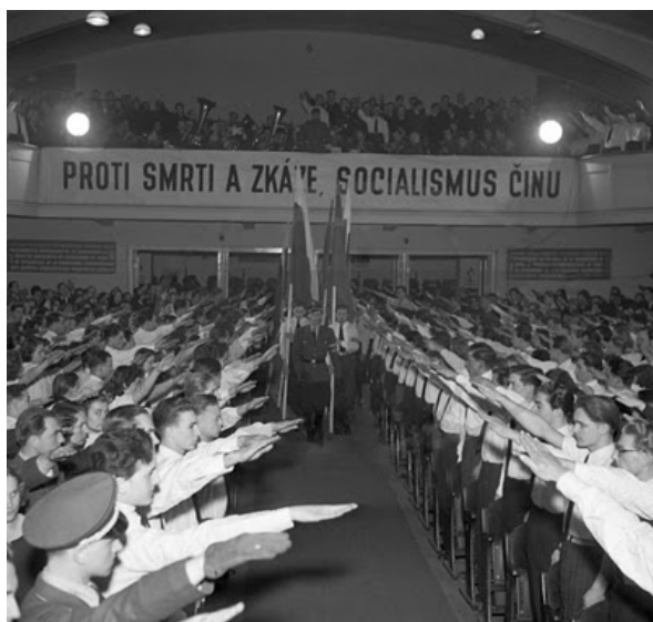
Jdeme s Říší!