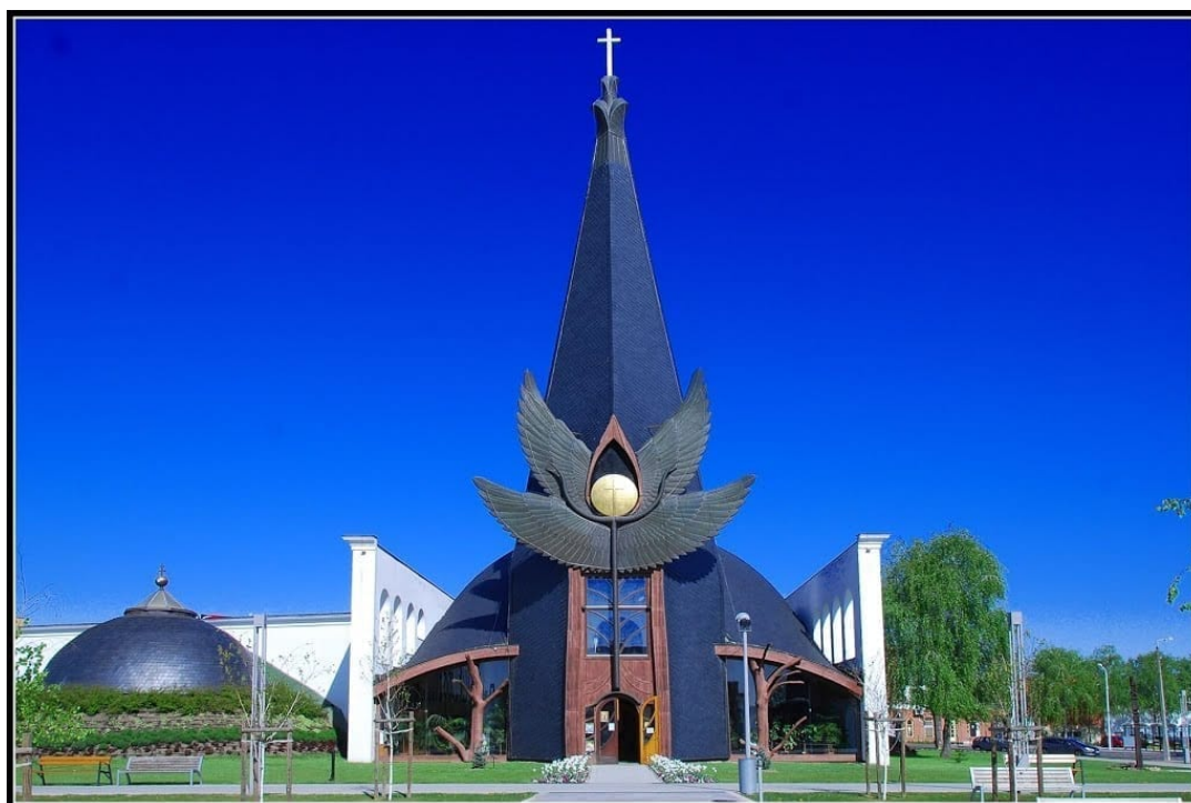
Kostel v Százhalombattě

V podobném stylu vznikl i kostel v Százhalombattě, jehož kupoli podpírají tři stromovité pilíře, s už známým motivem křídel v průčelí. Kruhový otvor v kupoli odkazuje na tvar tradiční maďarské jurty: věřilo se, že otvorem ve stropu jurty se mohou dovnitř dostávat šamany vyvolaní duchové.