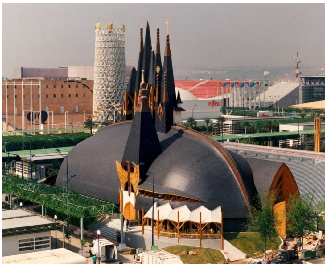
Maďarský pavilon na výstavě EXPO v Seville

Jakkoliv kriticky Makovecz vystupoval proti monotónní prefabrikovanosti moderních staveb, nelze říct, že by odpůrcem modernismu jako takového. Jeho architektura není reakcionářská a dává si mnohem větší ambice, než jen otrocky kopírovat tradiční styly. Jak poznamenal Thorsten Botz-Bornstein „... přestože se organická kultura kriticky vyjadřuje proti určitému druhu technologické a mechanické kultury, směřují její estetická vyjádření vždy do budoucnosti... Organicismus usiluje o vytvoření odlišné, alternativní podoby modernity – a Maďarsko se pro tento experiment jeví být vhodným prostředím.“ 3] Makovecz se tak v mnohém podobá svému krajanu Bélovi Bartokovi , v jehož modernistických skladbách lze také rozeznat vliv maďarské lidové hudby.