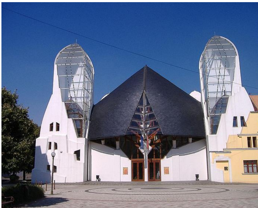
Cibulový dům, Makó

Makovecz patřil k zakládajícím členům Maďarské akademie umění, jež vznikla v roce 1992 na podporu maďarského umění a kultury. Až do své smrti stál v jejím čele. Viktor Orbán v roce 2010 tuto instituci zahrnul pod záštitu maďarské vlády.