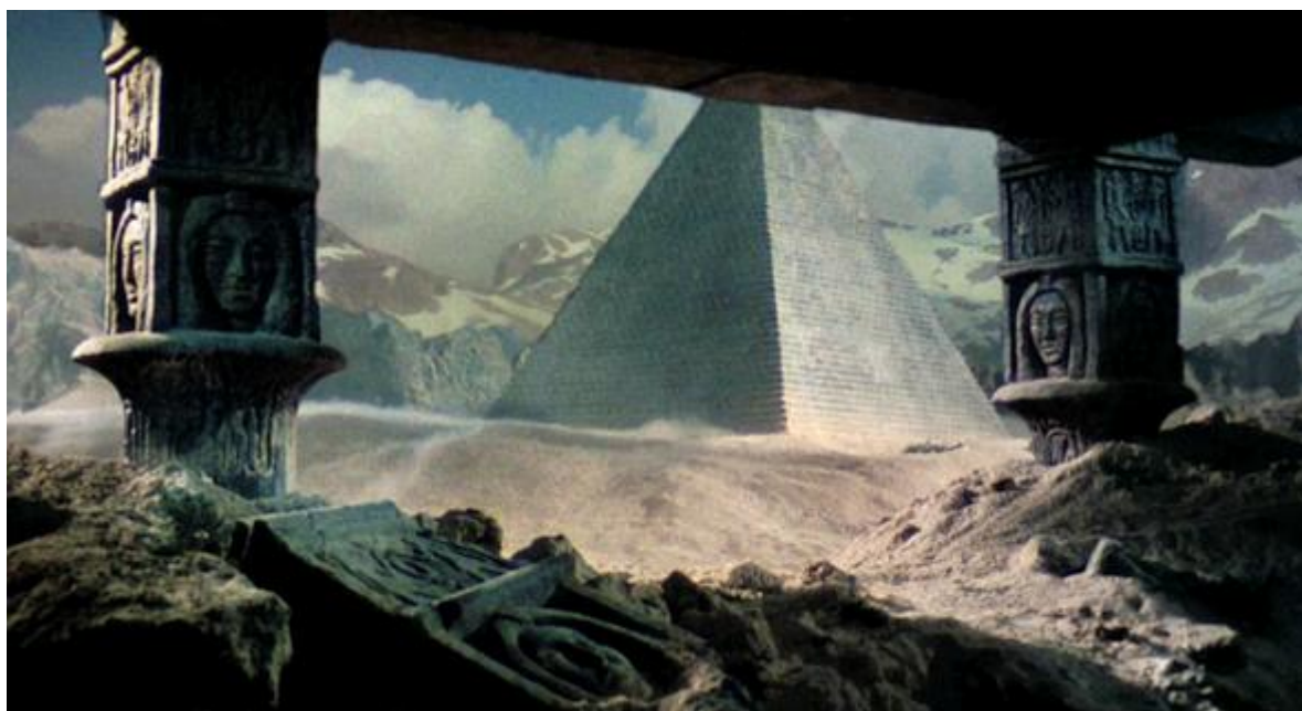
Thule - Tula - Tullan, Země Slunce na Dálném severu, v představě filmového architekta pohádky Sindibád a tygří oči...

Po zničení Vaédža Ářjů/hory Méru/Edenu/ Hyperboreje museli přeživší polobohové odejít na jih. I ve vyhnanství si ale uchovali paměť na svou arktickou domovinu, jak ukazují polární symboly jako svastika (lámaný kříž otáčející se kolem pevného bodu) a světový strom, který prorůstá světy jako osa a podle tradice spojuje Midgard (Zemi) se světy nad ním. Někteří osídlili části Severní Ameriky a sever Evropy, větší část se jich však přeskupila v Atlantiku, aby tam obnovili svou civilizaci.