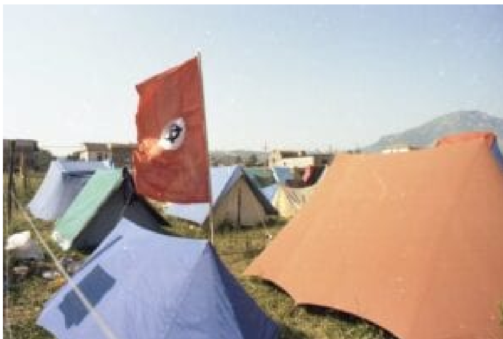
Stanové městečko Campo Hobbit. Keltský kříž, zde užitý jako nacistickou vlajkou inspirovaný prapor, se stal symbolem hnutí, jež z Tábora Hobit vzešla.