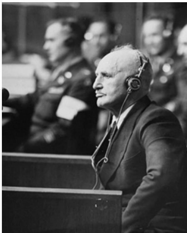
Julius Streicher v Norimberku