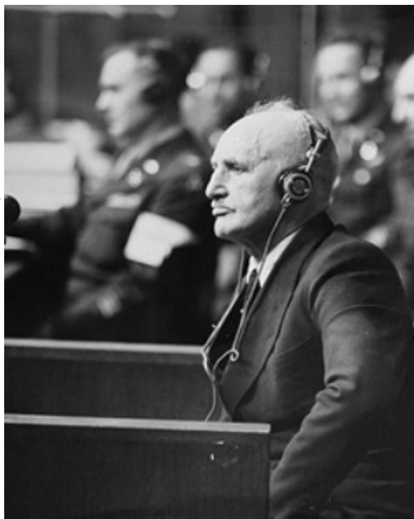
Julius Streicher v Norimberku