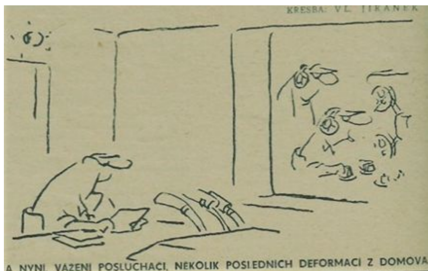
1968: pětadesát let starý Jiránkův vtípek