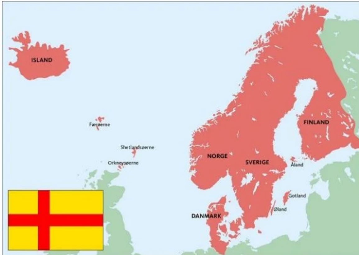
Kalmarská unie (1397 - 1523)