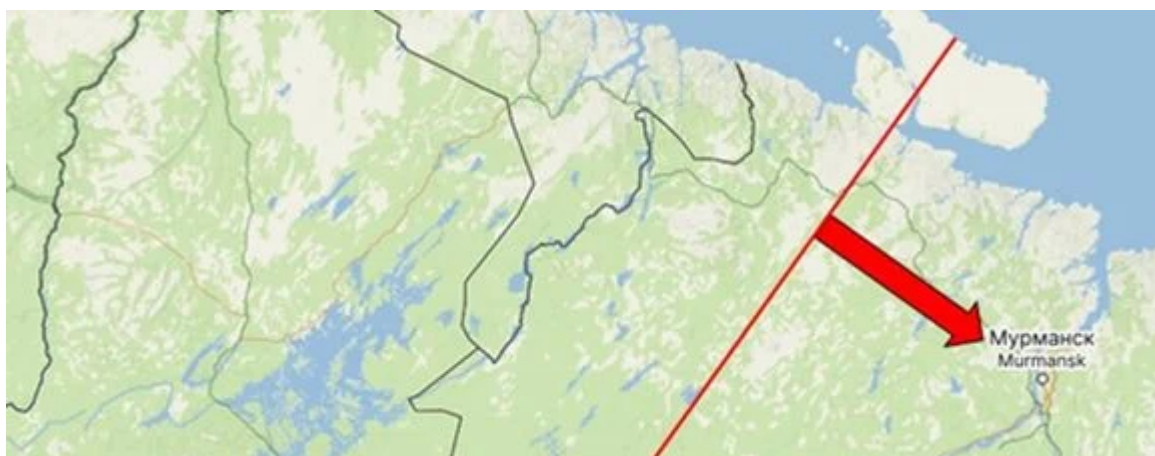
Murmansk po mírové smlouvě z Tartu

Kromě ztráty zásob niklu (které více než bohatě dnes nahrazuje monogorod Norilsk na Sibiři) došlo k tomu, že Severomořská flotila kotví v Murmanském fjordu byla vystavena nepříteli na vzdálenost 30 km. Vzdálenost Murmansku od Petrohradu je 1300 km. V případě náhlého útoku nebylo možné strategický nezamrzající přístav bránit. Totéž ovšem platí i pro Finsko, které by jinak ztratilo přístup k Ledovému oceánu.