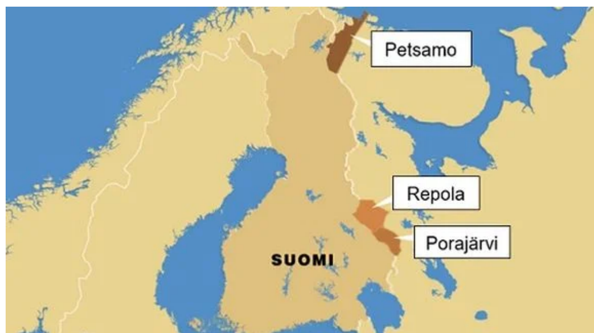
Hranice mezi Finskem a SSSR po mírové smlouvě z Tartu (1920)

Region Petsamo s Rybářským poloostrovem připadl Finsku. Leží zde významné město Nickel, kde se těží nikl, nedaleko kotví Severní flotila. Regiony Repola a Porajärvi ve Východní Karélii připadly SSSR. Pro Sovětský svaz šlo o krajně nevýhodnou smlouvu.