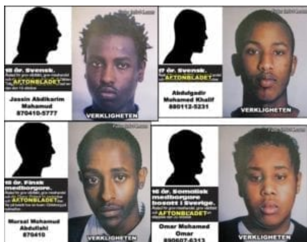
Siluety v novinách a realita

Aftonbladet uvádí do pohybu svůj osvědčený aparát lží a označuje pachatele za „Švédy“ a dokresluje jejich profily typickou siluetou Evropana. Čtenář má uvěřit, že somálští pachatelé byli etnickými Švédy. Dokonce i Expressen ohledně etnicity pachatelů klamal.