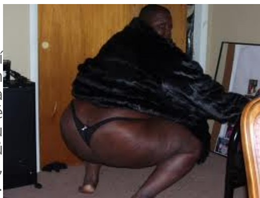
Africká představa o „CrossFit zadku“

Z evolučního hlediska je mužská fixace na „zadní vycpávky“ oplodňovací oblasti mladých zdravých žen naprosto pochopitelná. Někteří černoši si potrpí na gigantická hotentotská pozadí a znám některé bílé chlápky, kteří nedají dopustit na rubensovské, želatinu připomínající pozadí, ale drtivá většina mužů pochopitelně dává přednost dokonale oblému, perfektnímu pozadí, signalizujícímu mladistvou plodnost.