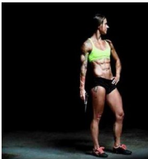
Nový ideál ženské krásy?