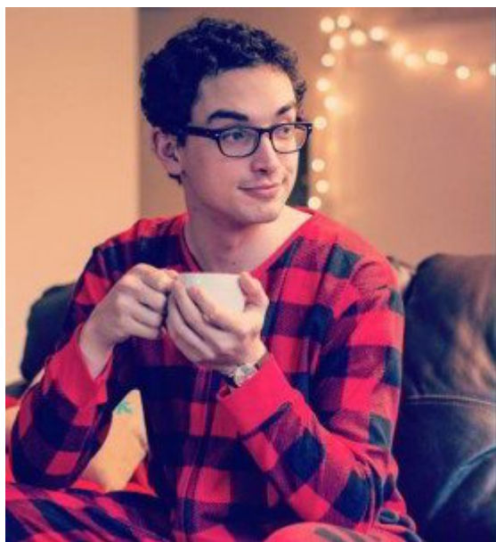
Semitský pyžamák – Obamovo marketingové eso v rukávu

Na okrajových případech tolik nezáleží – dokud jich není použito k novému vymezení středu a normálu.