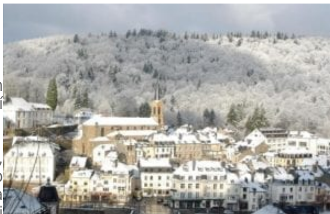
Kostel ve Velitelově rodném Bouillonu dnes...

Byli jsme si jistí, že jsme spatřili svatého Josefa, jak zahýbá do Rue du Moulin. O půlnoci se do prudkého kopce ke kostelu šlapalo ztěžka. Na posledním strmém úseku nám dovolili vzít si dřeváky do ruky. Poté jsme z noci mrazivých šipek bryskně přešli do hřejivé vůně skvělých chrámových lodí.