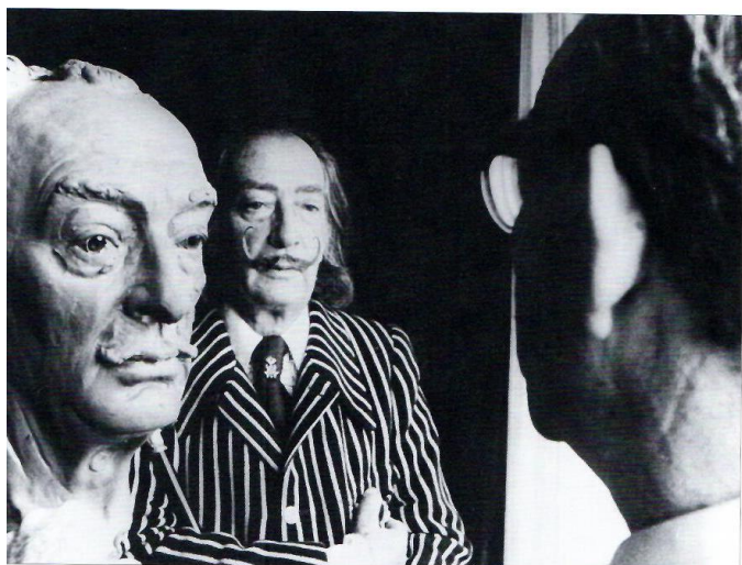
Arno Breker portrétuje Dalího (1974)