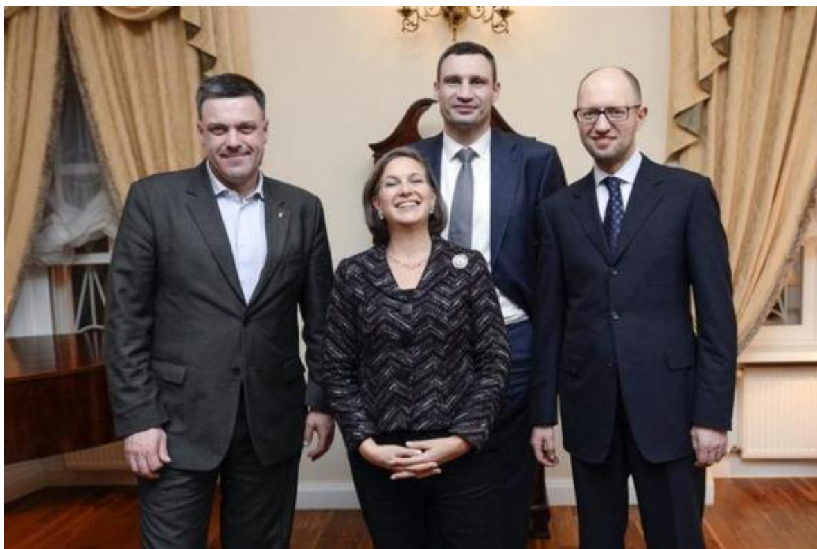
Jeden z hlavních autorů Národního manifestu, ukrajinský „nacionalista“ Oleg Tahnybok a Victoria „Fuck the EU!“ Nuľand.