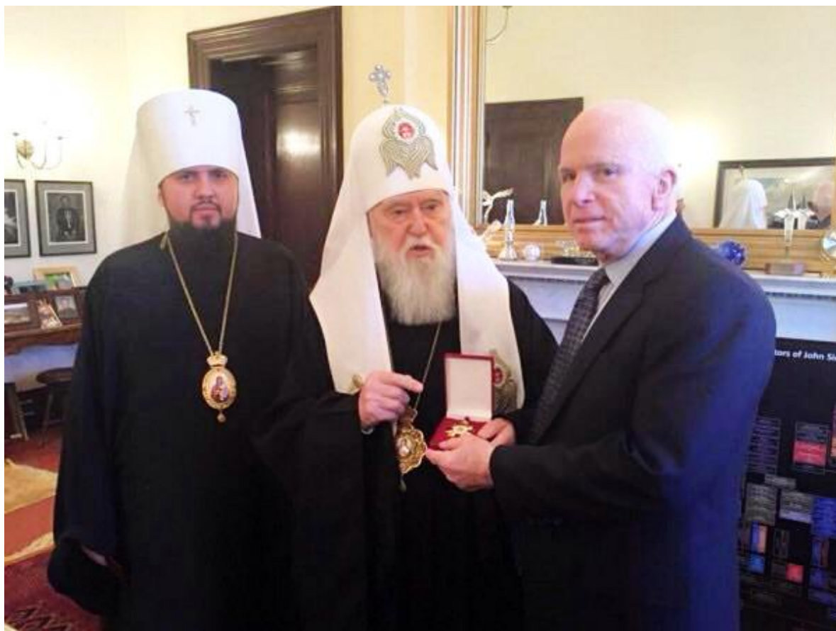
Filaret orodující u přátel.

církev Kyjevského patriarchátu vedená exkomunikovaným samozvaným patriarchou Filaretem neuznává žádná pravoslavná církev na světě. Tento pseudopatriarcha ostatně sám proslul svými podivnými a podle všeho nekřesťanskými prohlášeními, když vyzýval donbaské civilisty ke smytí svého hříchu vyhlášení nezávislosti krví a utrpením.