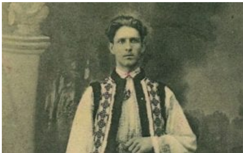
Corneliu Codreanu (1899-1938), zakladatel a vůdce Legie archanděla Michaela, také známé jako rumunská „Železná garda.“

Při příležitosti Codreanuových nedožitých 117. narozenin přinášíme našim čtenářům jeho postřehy k demokracii v její moderní, liberální podobě. Redakce DP