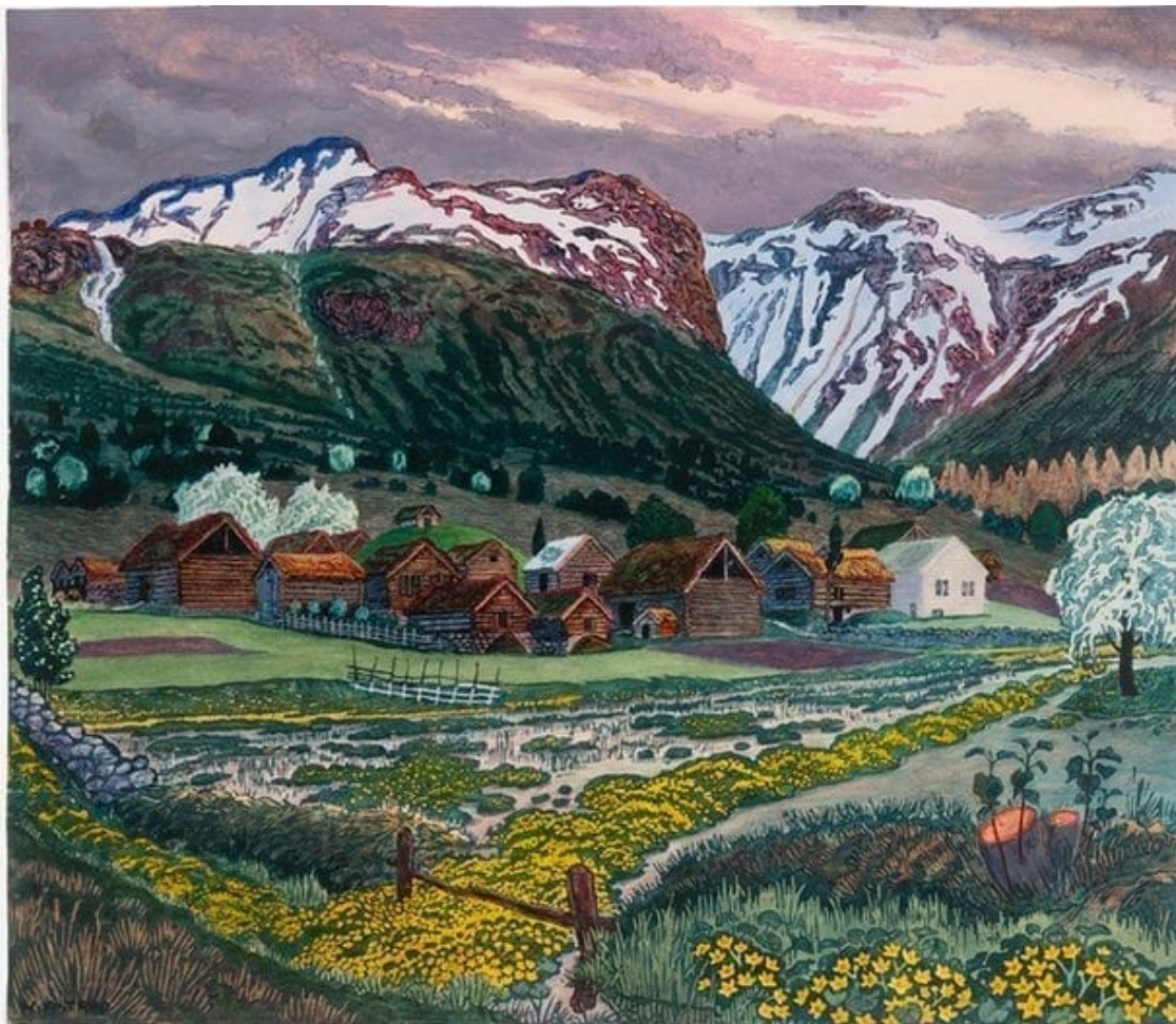
Nikolai Astrup: Noc nad mokřinou s blatouchy, kolem r.1915.

A právě kvůli jemnosti Astrupova díla – lásce k přírodě a idylickému zpodobnění venkovského života – jej v rodném Norsku nepochybně tak milují. Dnes se ale stal dalším kamenem v mozaice rozšiřujícího se povědomí o skandinávském umění mimo Skandinávii. Tato výstava přichází po jiné fascinující výstavě [londýnské] Národní galerie z minulé zimy, zaměřené na norského krajináře 19. století Pedera Balkeho . Astrup pak dokazuje, že Balkeho romantismus byl přítomen i v Norsku století dvacátého.