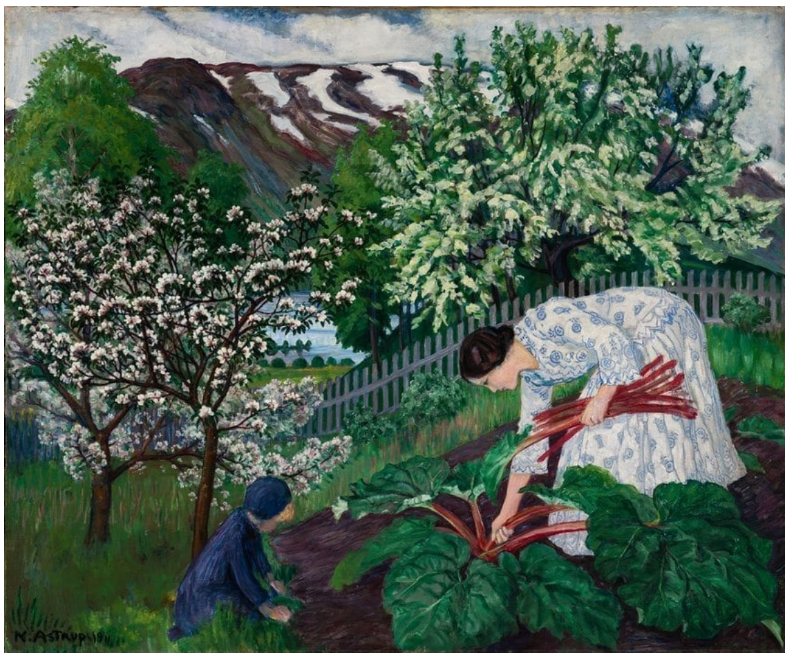
V Norsku 20. století byl romantismus stále živý... Nikolai Astrup: Rebarbora, 1911.

Za další „objevy“ skandinávských umělců britskými galeriemi lze považovat dva dánské malíře: Christena Købkeho a Vilhelma Hammershøiho.