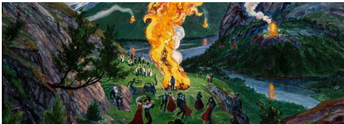
Nikolai Astrup: Vatra o letním slunovratu, před r. 1915.