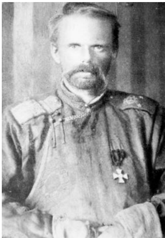
Roman Fjodorovič Ungern von Sternberg

První úlohou potápěče je vyzvedávat ze dna zapomenutí. Nedávno při tom jeden z nás odkryl tento zasutý skvost.