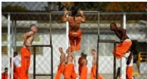
Svůj k svému