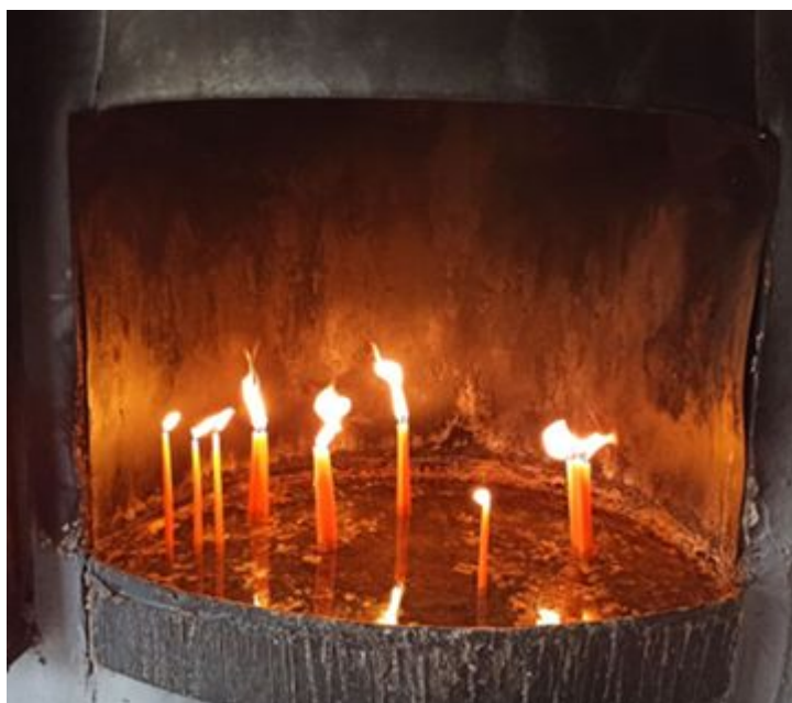
Svíce v pravoslavné kapliče

Dovolím si opominout rozdíly mezi ortodoxními a římskokatolickými kostely, které spočívají v architektuře a výbavě interiéru. 2] Zajímavější než vizuální odlišnosti jsou jeden čichový a jeden sluchový. Obojím pravoslavný chrám expanduje daleko do prostoru . Téměř se vnucuje myšlenka, že si tím nahrazuje léta osmanské nadvlády, kdy kostely nemělo být slyšet, a tak zvony po staletí mlčely, aby se nepřekřikovaly s muezziny. Hluk dnes ovšem nedělá ani tak vyzvánění, jako spíše kázání a modlitby: rozléhají se nad ulicemi nebo i nad celými čtvrtěmi. Třebas soluňský Hagios Pavlos (vyrostl nad pramenem, z něž údajně pil sv. Pavel z Tarsu) proznívá borovým hájem vysoko nad mořem. – Ještě víc než slovem kostely pronikají do okolí kadidlem: to se plazí i desítky metrů daleko, zbarvujíc vzduch čímsi sakrálním.