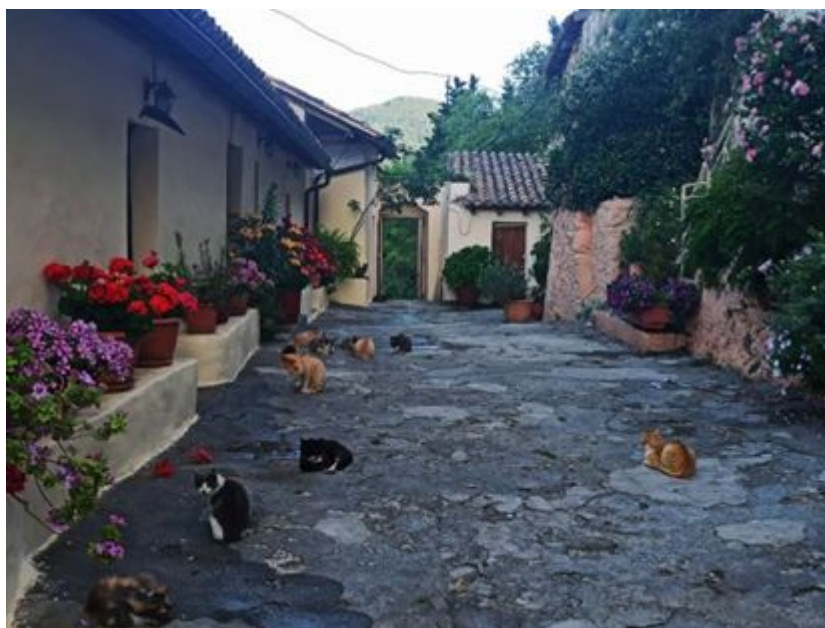
Tuláčci na nádvoří kláštera v Mystře

Karel Čapek v Cestě do Itálie památně popisuje Forum Romanum obležené kočkami. Zatímco z Fora se je podařilo vystěhovat, antickým památkám v Helladě kralují dodnes. Tak například obývají mamutí palácový komplex, který v Soluni vystavěl římský císař Galerius (258-311). Procházejí se po jeho rudých zdech z obnažených cihel, čistí si kočičky v trávě mezi rozvalinami a nonšalantně dávají najevo, že sídlo patří vlastně jim. Spávají na hlavicích antických sloupů. Jakmile v březnu na athénské nekropoli Kerameiku vyrostou tráva a prokvetou pampeliškami, honí si v ní ocas. Kojí svá kořata mezi zborcenými architrávy Olympie – živé na pozadí mrtvého. V monastýrech Meteory se dávají krmit popy, v Mystře jeptiškou. Oživují každou ruinu, jsou dušemi Recka.