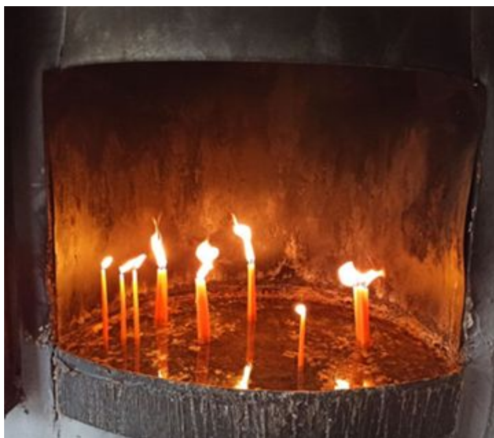
Svíce v pravoslavné kapličky

Dovolím si opominout rozdíly mezi ortodoxními a římskokatolickými kostely, které spočívají v architektuře a výbavě interiéru. 2] Zajímavější než vizuální odlišnosti jsou jeden rozdíl čichový a jeden sluchový. Obojím pravoslavný chrám expanduje daleko do prostoru . Téměř se vnucuje myšlenka, že si tím nahrazuje léta osmanské nadvlády, kdy kostely nemělo být slyšet, a tak zvony po staletí mlčely, aby se nepřekřikovaly s muezziny. Hluk dnes ovšem nedělá ani tak vyzvánění, jako spíš kázání a modlitby: rozléhají se nad ulicemi nebo i nad celými čtvrtěmi. Třebas soluňský Hagios Pavlos (vyrostl nad pramenem, z něž údajně pil sv. Pavel z Tarsu) proznívá borovým hájem vysoko nad mořem. – Ještě víc než slovem kostely pronikají do okolí kadidlem: to se plazí i desítky metrů daleko, zbarvujíc vzduch čímsi sakrálním.