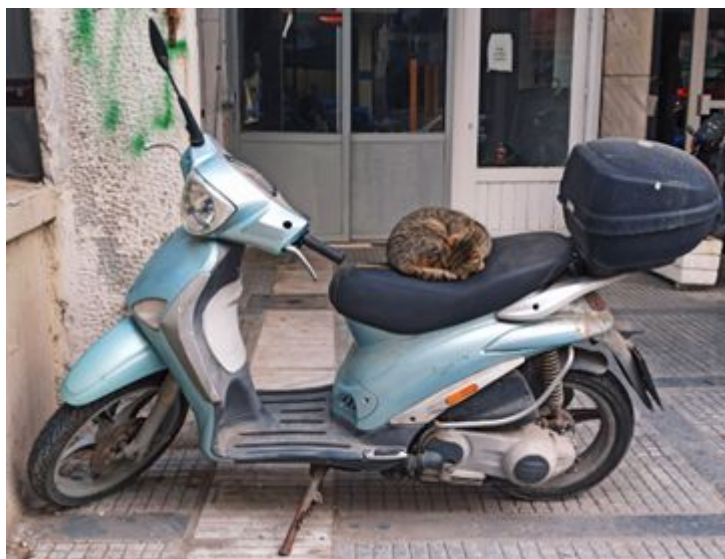
Na řecké ulici

Řečtí chodci si rovněž zaslouží zmínku. Předně: pohybují se zásadně v rojnicích. Jsou to šinoucí se, temperamentně rozprávějící útvary sahající z jednoho okraje chodníku na druhý. Řek zřídka spěchá, například na autobus (a to navzdory tomu, že nikdo neví, kdy a jestli pojede nějaký další). Chcete-li rojnici předejít, nesmírně ji tím překvapíte; ve své typicky helénské laskavosti se však přece jen rozestoupí. Ví totiž, že jít po silnici vám často znemožňuje provoz a jeho zákon silnějšího.