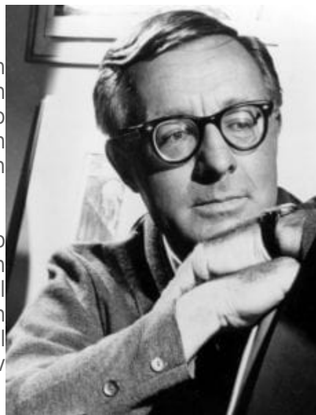
Ray Bradbury (1966)

Z podobné zkoušky ohněm se dříve rodili velcí spisovatelé. Autora tvořil rovný díl inspirace, odhodlání a ochota riskovat vše v naději - často hraničí s šílenstvím - že se i někomu jinému bude líbit to, co píše. V Americe dneška se člověk, který se rozhodne stát spisovatelem, obvykle zapíše do vysokoškolských kurzů tvůrčího psaní a následně - pokud mu nechybí ambice - pokračuje doktorským studiem a titulem, po němž jej čekají nekonečné „workshopy“, kde se učitelé nenadaní brilantním talentem pokouší naučit potenciální