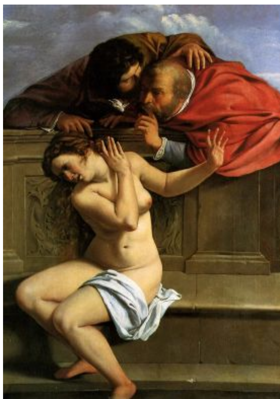
Artemisia Gentileschiová - Zuzana a starci (1610)