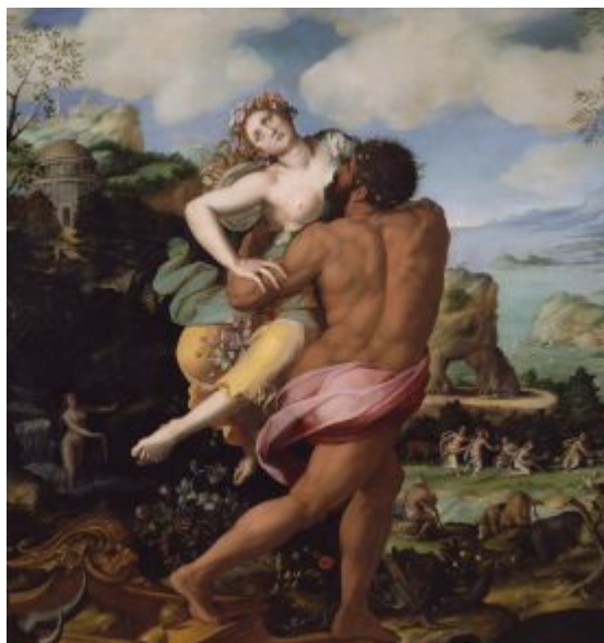
Alessandro Allori - Unos Persefony (1570)