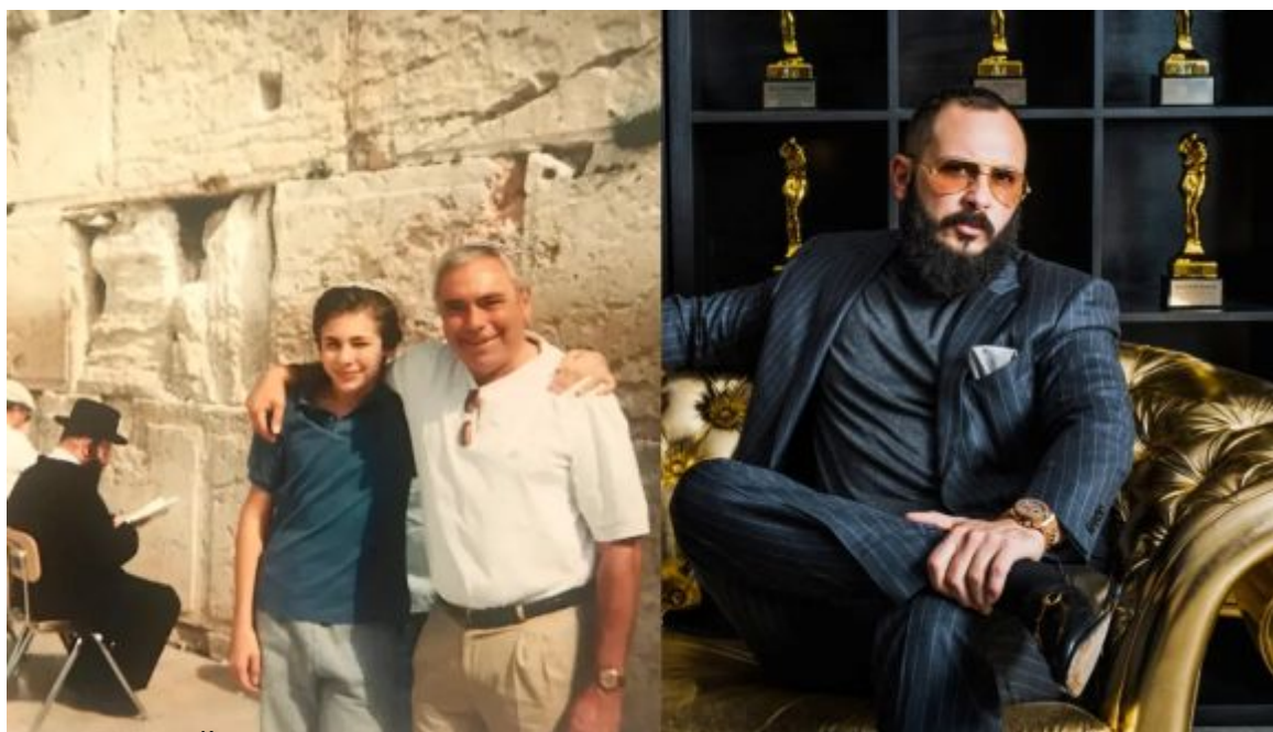
Židovský porno magnát Greg Lansky u Zdi nářků

Dobrým příkladem budiž i Greg Lansky . Sebestředný židovský porno magnát z Francie se vyžívá v záři reflektorů a jasně ukazuje, že producentům porna nemusí nutně jít jen o peníze. V rozhovoru pro Haarec je Lanskyho vyprávění o „opakovaných setkáních s antisemitismem“ během svého dospívání ve Francii doplněno fotkou z jeho návštěvy u Zdi nářků v dětství. V nápadně se opakujícím motivu se svěřuje, že ho ke kariéře ve filmech pro dospělé „přivedl i pocit sounáležitosti s bojovníky za přijetí“. 7]