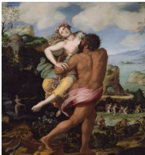
Alessandro Allori - Unos Persefony (1570)