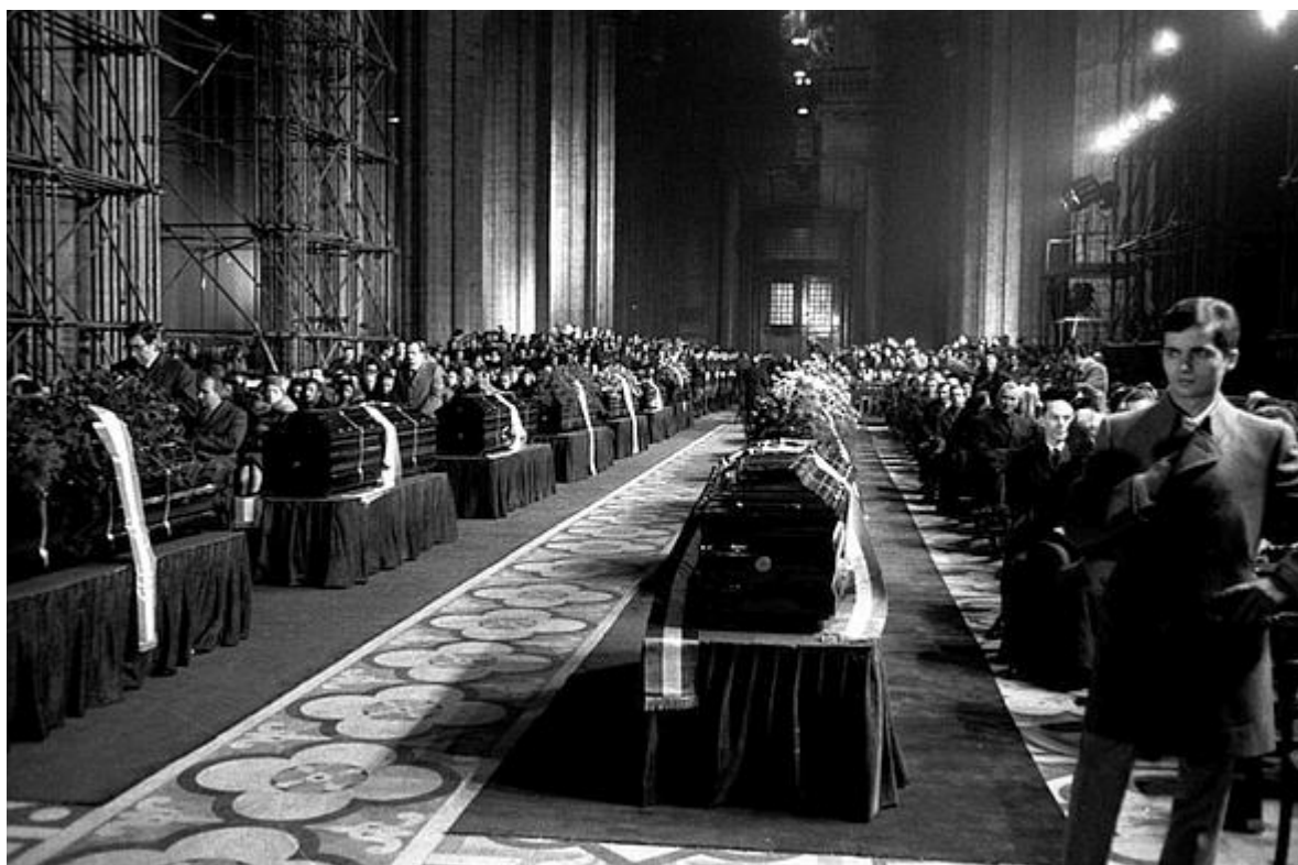
Pohřeb obětí atentátu na Piazza Fontana v milánské katedrále Narození Panny Marie.