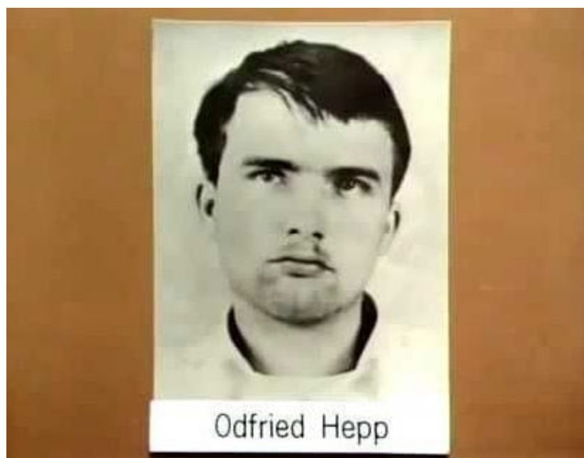
Me ne frego.