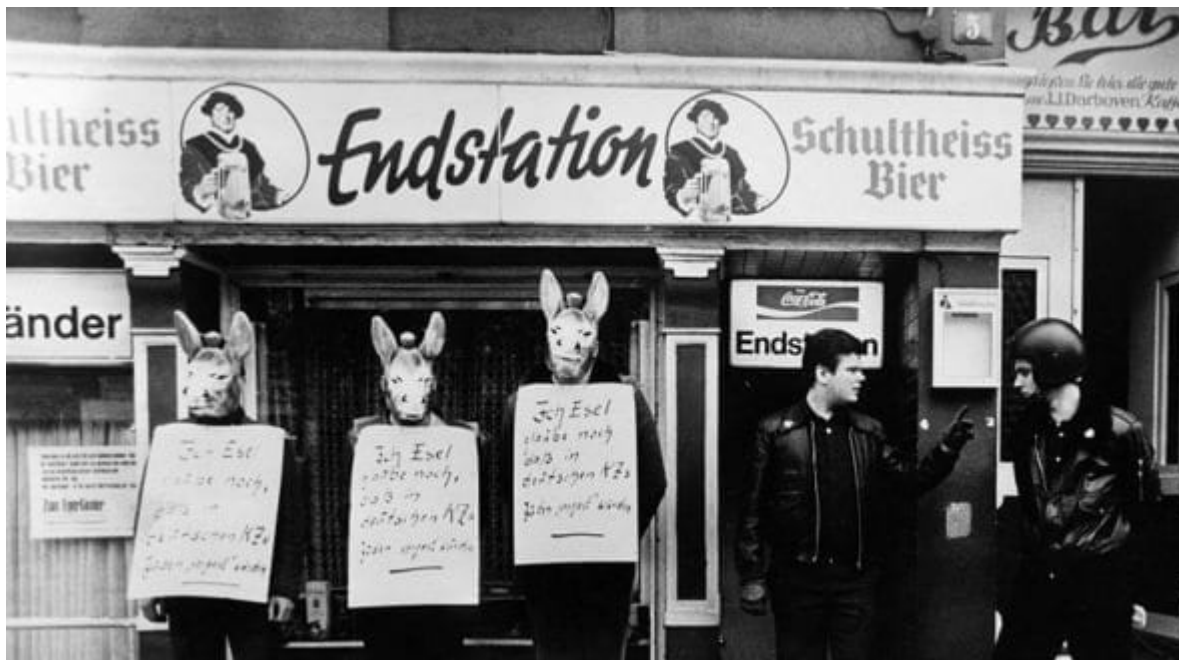
Snímek z happeningu ANS. Michael Kühnen druhý zprava.