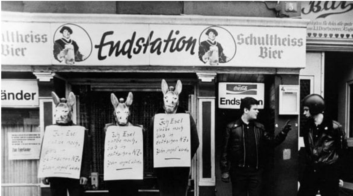
Snímek z happeningu ANS. Michael Kühnen druhý zprava.