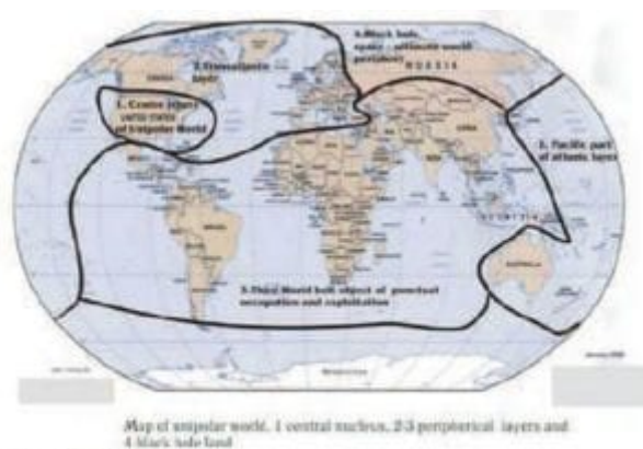
Zdroj: Dugin 2004

Jak již bylo uvedeno, multipolární eurasijský model je alternativou unipolárnímu globalizovanému světu řízenému thalassokratickými mocnostmi v čele s USA. Globalizace je pak traktována jako jednodimenzionální a jednovektorový fenomén, který se tenduje k univerzalizaci západního pohledu na svět a ke konformnímu výkladu lidské historie (Dugin 2004). Z atlantického pohledu je možné dělit svět na několik zón - samotnou Ameriku s Evropskou unií, která představuje americkou periferii, asijskou a pacifickou oblast, která je vzdálenější periferií, a Rusko a Střední Asii, které ovšem nepředstavují autonomní a jakkoliv významný pól - svět je z tohoto pohledu tedy unipolárním systémem s centrem na západním břehu severního Atlantiku (Dugin 2004).