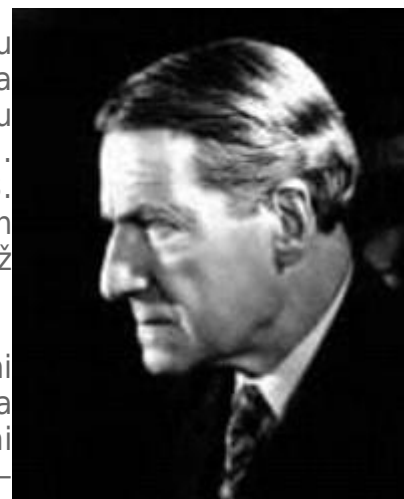
rabíin Stephen Wise

Oplýval právníkou verbální sofistikou a přetékal nejnovějšími liberálními frázemi o žádoucnosti „míru bez vítězství“, „světa bezpečného pro demokracii“, ale zřejmě neměl ani zájem, ani povědomí o realitě situace, k níž se mělo jeho Čtrnáct bodů – stejně jako „Čtyři zásady“ z 11. února 1918, „Čtyři cíle“ (4. července 1918) a „Pět detailů“ (27. září 1918) – údajně vztahovat.