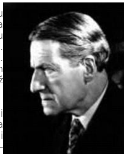
rabín Stephen Wise

Oplýval právníkou verbální sofistikou a přetékal nejnovějšími liberálními frázemi o žádoucnosti „míru bez vítězství“, „světa bezpečného pro demokracii“, ale zřejmě neměl ani zájem, ani povědomí o realitě situace, k níž se mělo jeho Čtrnáct bodů – stejně jako „Čtyři zásady“ z 11. února 1918, „Čtyři cíle“ (4. července 1918) a „Pět detailů“ (27. září 1918) – údajně vztahovat.