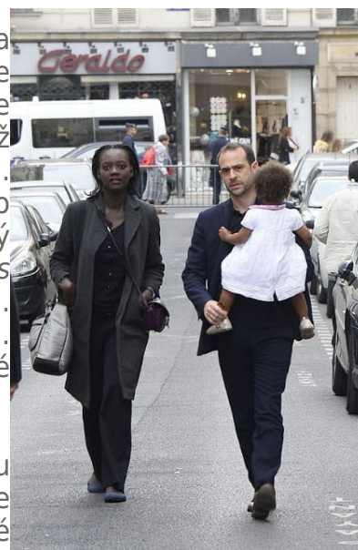
Senegalsko-židovsko- „francouzská“ rodina

Abychom se ale vrátili k otázce intelligence: umělci až donedávna bývávali velmi inteligentní lidé. Vpustit mezi skutečné umělce příslušníka cizí rasy by ale znamenalo katastrofu, jelikož by se snažil přizpůsobit vnímání světa svému vlastnímu obrazu. Totéž platí i pro nižší úroveň a jednotlivce rozumově méně nadané. Každý má své normativní chápání světa, které vychází z jeho vlastní etnické tradice. Z multirasové společnosti zrozený multikulturalismus tento (nikoliv univerzální, ale etnický) logos nahrazuje nekonečně proměnlivým schizofrenním chaosem. Levice to nijak nerozporuje a její umění to jen potvrzuje. Vezměme si nejnovější trend transkulturní literatury, zastoupené třeba tímto dílem spisovatelky Julye Rabinowichové .