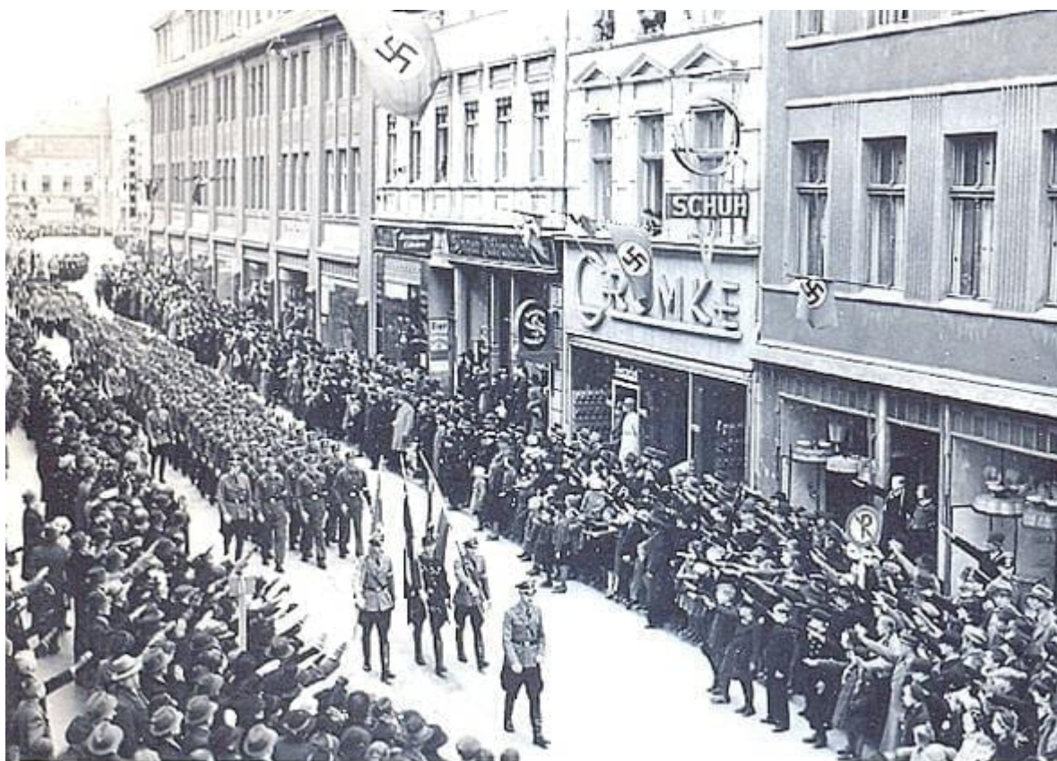
Pochod NPEA Jungmannen centrem Köslinu v den oslavy Vůdcových narozenin 20. dubna 1939.

Dnes jsme pochodovali do Köslinu (Institut je asi dva kilometry za městem) na oslavy Vůdcových narozenin. Následovala přehlídka před ředitelem institutu. Skoro mi umrzly prsty.