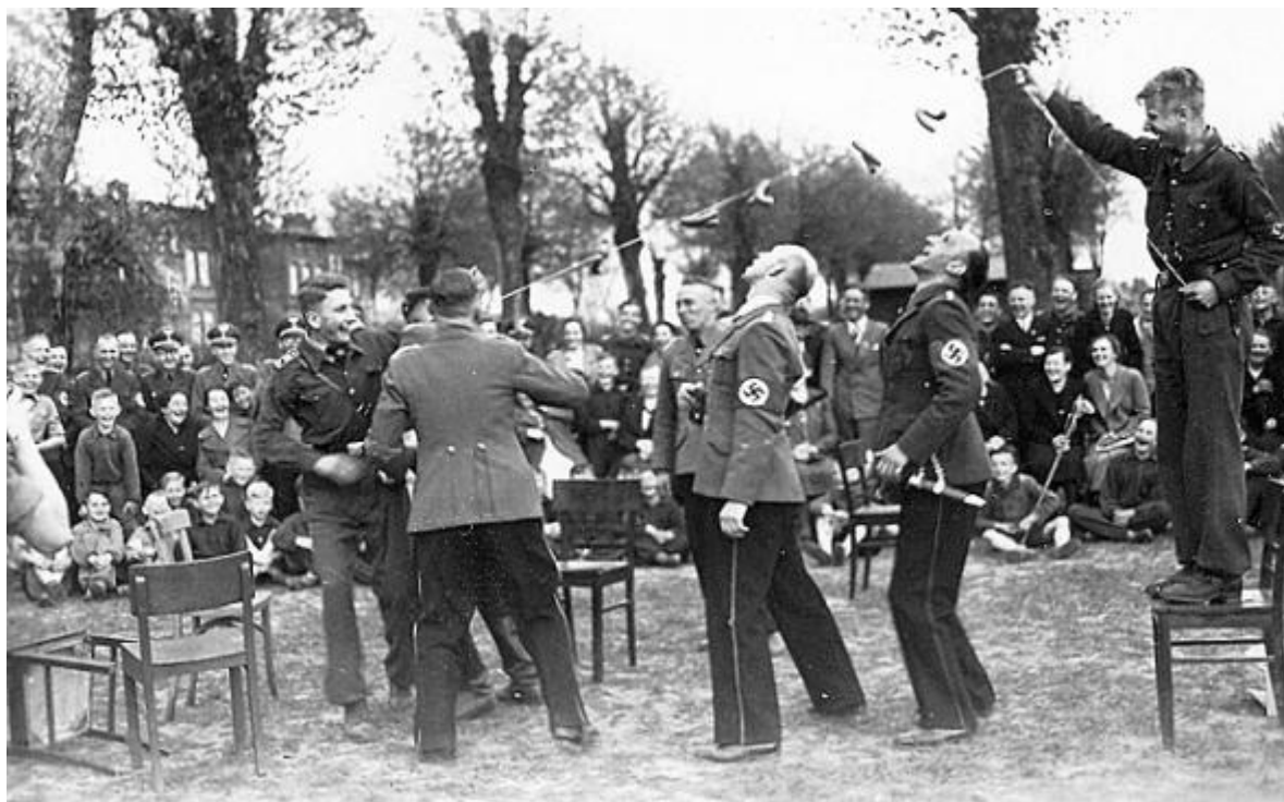
Společenská akce. Pro pobavení obyvatel města se učitelé NPEA Köslin účastní hry, v níž se snaží ústy zachytit kousky klobás visící ze šňůry držené studenty.

Na něco jsem ale zapomněl: 17. jsme navštívili školu Luftwaffe a berlínské letiště Gatow . Hodně jsme toho viděli, ale nic dalšího zajímavého se nestalo. Zrovna nás volají k obědu: kotlety, brambory, ovocný kompot, káva a vdolky.