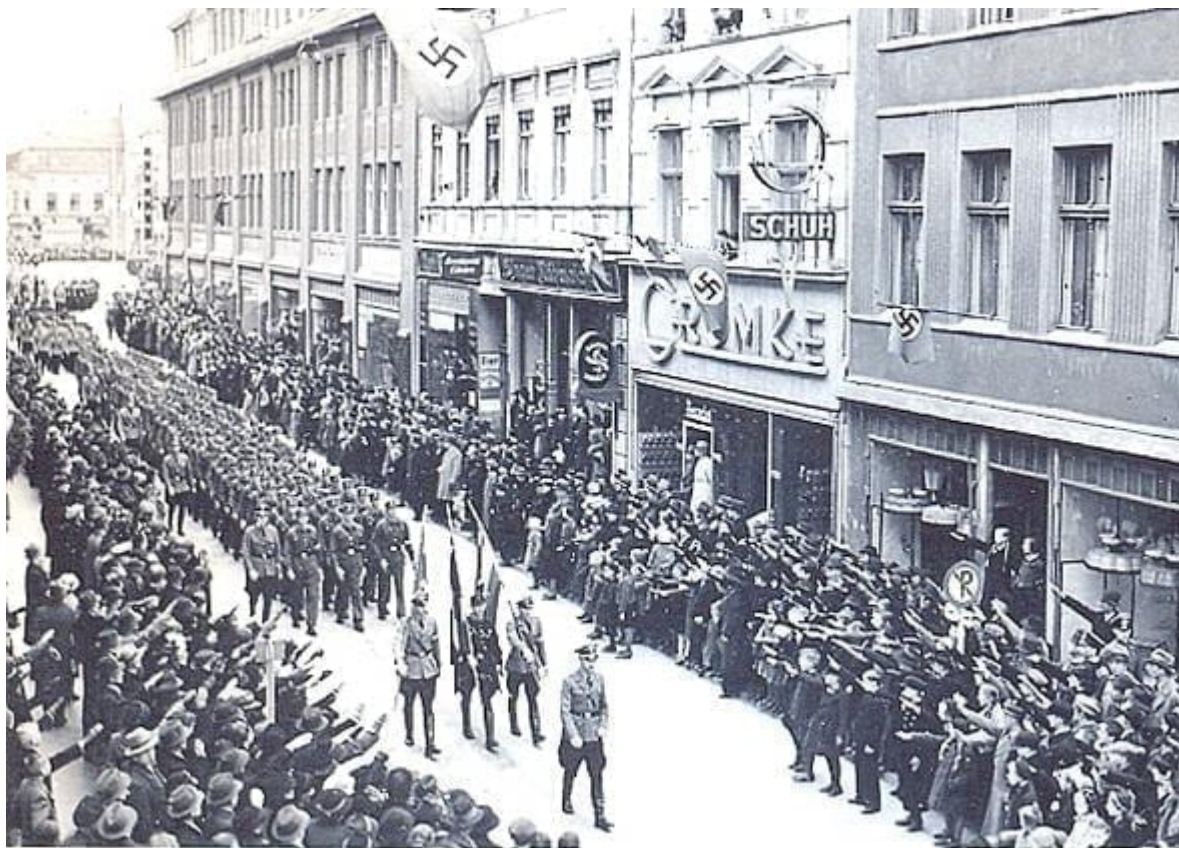
Pochod NPEA Jungmannen centrem Köslinu v den oslavy Vůdcových narozenin 20. dubna 1939.

Dnes jsme pochodovali do Köslinu (Institut je asi dva kilometry za městem) na oslavy Vůdcových narozenin. Následovala přehlídka před ředitelem institutu. Skoro mi umrzly prsty.