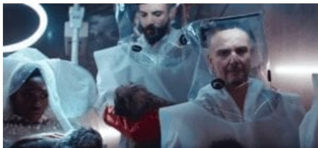
Hlubinný rozměr klipu

Zato budoucnosti se videoklip věnuje důrazněji. Kosmonauti Rammstein jistě nejsou odkazem k prvnímu německému kosmonautovi Sigmundu Jähnovi. Kapela zde nemá totiž vesmírnou loď, v níž by cestovala do vesmíru, ale ponorku. Opět se zde pracuje s motivem inverze, kdy místo aby Německo expandovalo a pozvedlo se vzhůru k nebesům, potápí se do hlubin. V kombinaci s odkazem na zánik německého národa se ve videu rodí německo-černošští psi – nevybíravá narážka na migrační krizi a velkou výměnu obyvatelstva. Na konci videoklipu se Němci budoucnosti (opět ztělesnění kapelou) na pozadí velkolepého starého Německa, tj. monumentálních staveb, loučí s diváky a namísto dětí (nových Němců) drží ve svých náručích psy. Mrtvou Germánii pak v rakvi odesílají do vesmíru.