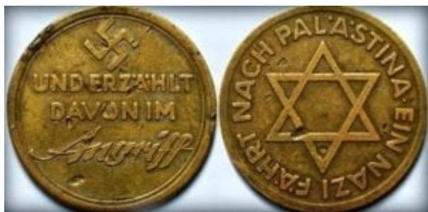
Pamětní medaile na cestu Leopolda von Mildensteina do Palestiny.

„Uznání Židovstva za rasové společenství založené nikoliv na víře, ale na krvi, vede německou vládu k bezvýhradnému poskytnutí rasové svébytnosti tomuto společenství. Postoj vlády se plně shoduje s širším duchovním hnutím, tak zvaným sionismem, v uznání solidarity Židovstva po celém světě a odmítnutí asimilace. Proto Německo podniká opatření, která budou nepochybně hrát významnou úlohu při řešení židovské otázky ve všech zemích světa.“ [11]