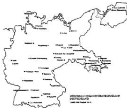
Mapa sítě asi 40 táborů a zemědělských center sionistické mládežnické organizace he-Chaluc v Německu.

Himmlerova bezpečnostní služba také spolupracovala s Haganou, sionistickou podzemní vojenskou organizací v Palestině. Úřad SS platil jednomu z jejích představitelů Feivelu Polkesovi za informace o situaci v Palestině a pomoc při soustředění židovské emigrace do země. Haganou měla spolehlivé zprávy o německých plánech díky špehovi, kterého se jí podařilo získat na berlínském velitelství SS. [20] Spolupráce SS s Haganou dospěla dokonce až k tajným dodávkám německých zbraní židovským osadníkům pro střety s palestinskými Araby. [21]