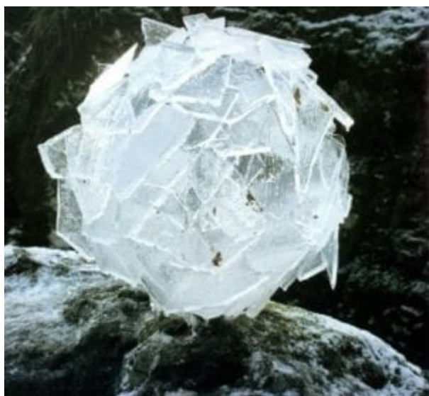
Andy Goldsworthy - Ice Ball (Ledová koule)

Když užívám výraz „posvátný“ ( numinous ), nemám na mysli nějakou vágní duchovnost či postmoderní výklady náboženství. Zajímá mě posvátno v tom významu, který popsal teolog Rudolf Otto. Ve svém díle Das Heilige - Über das Irrationale in der Idee des Göttlichen und sein Verhältnis zum Rationalen užívá Otto pojem posvátno k popisu náboženství v jeho rané, nejživotnější vývojové fázi. Právě tehdy dochází k přímému střetnutí se „zcela odlišným,“ tím co se nachází mimo přirozené formy. Náboženství postupem času část této vitality ztrácí a prostřednictvím morálních kodexů a esoterických rituálů kostnatí. Přímou zkušenost posvátna však člověk pociťuje jako děsivé, zdrcující setkání s čímsi, co se vynořuje z přírody, ale existuje mimo ni a není z ní odvoditelné. Posvátno se tedy nerovná uctívání přírody, ale může existovat vedle něj. Důležité je, že se jedná o projev čehosi mimo přírodní svět, mimo rámec našeho omezeného chápání, což mu dodává jeho bázeň vyvolávající charakter.